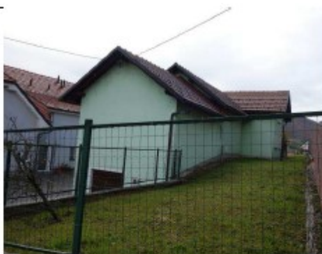
Objekt s severovzhodne strani