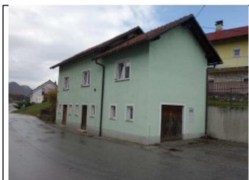
Objekt z jugovzhodne strani